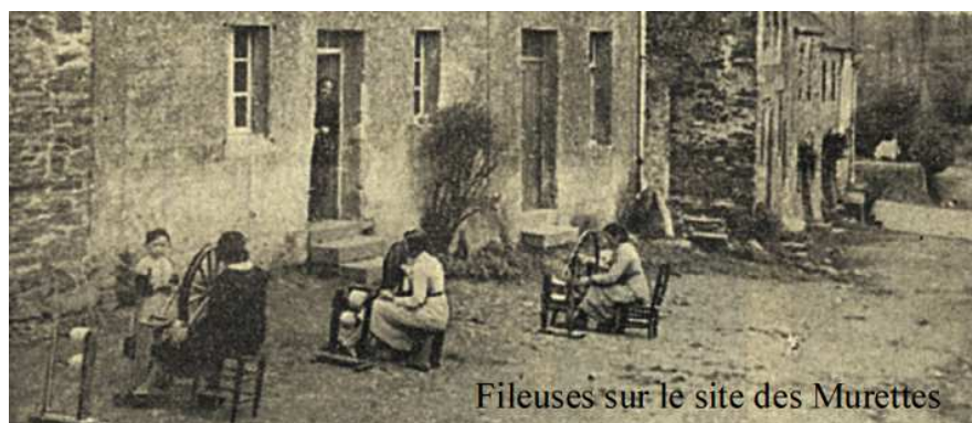
Fileuses sur le site des Murettes